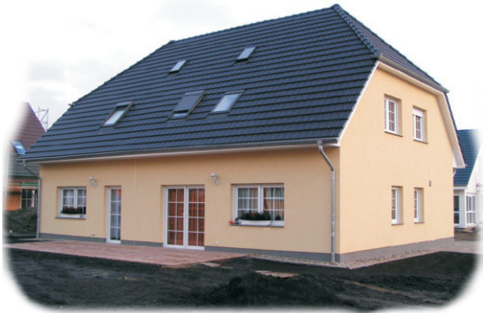
Abb. mit Sonderbauteilen

Wohnung 1 = 115 qm } Wohnung 2 = 83 qm } 198qm