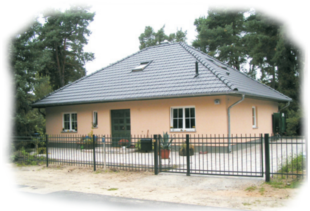
Abb. mit Sonderbauteilen

Bungalow "Lebnitz" 104 qm Wohnfläche • OG-ausbaufähig