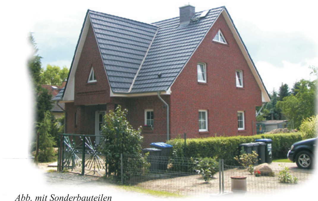
Abb. mit Sonderbauteilen