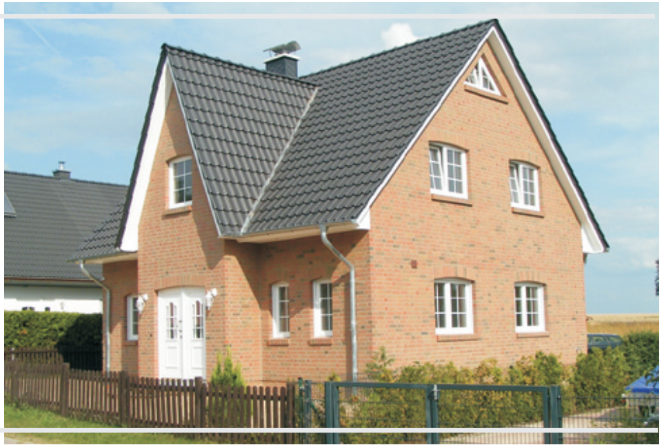
Abb. mit Sonderbauteilen