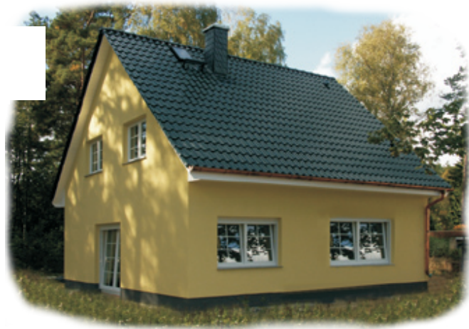
Abb. mit Sonderbauteilen