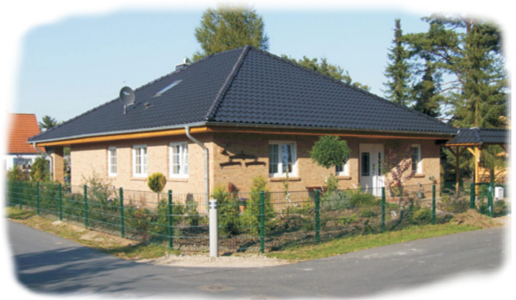
Abb. mit Sonderbauteilen

Winkel-Bungalow "Basdorf" 125 qm Wohnfläche • OG-ausbaufähig